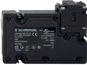
ID: ktfz-f14 | 350,6 kB | .jpg | 352.778 x 254 mm - 1000 x 720 px - 72 dpi | 34,7 kB | .png | 74.083 x 53.269 mm - 210 x 151 px - 72 dpi