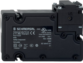
ID: ktfz-f14 | 350,6 kB | .jpg | 352.778 x 254 mm - 1000 x 720 px - 72 dpi | 34,7 kB | .png | 74.083 x 53.269 mm - 210 x 151 px - 72 dpi